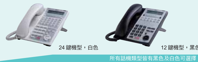
24 鍵機型, 白色