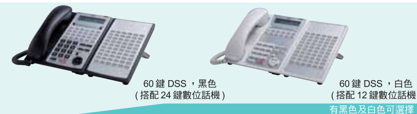
60 鍵 DSS, 黑色 (搭配 24 鍵數位話機)